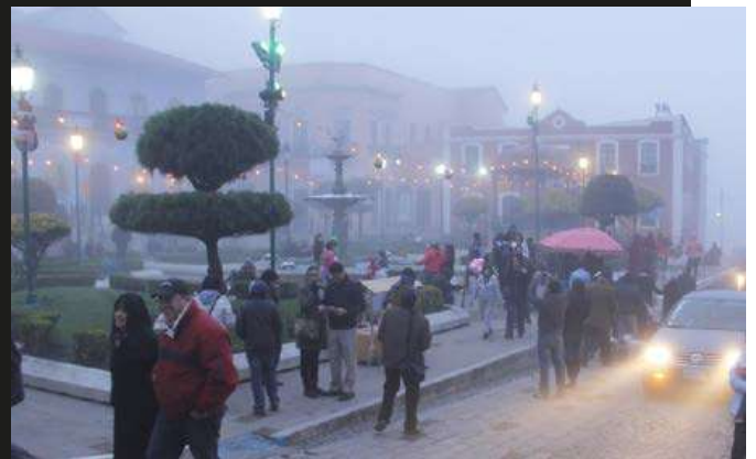
Real del Monte