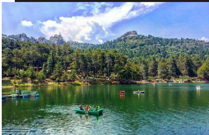
Mineral del Chico