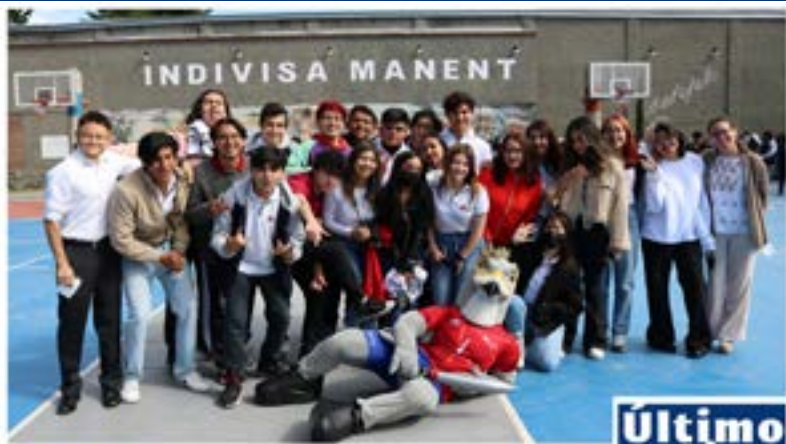
#Bachillerato La Luz