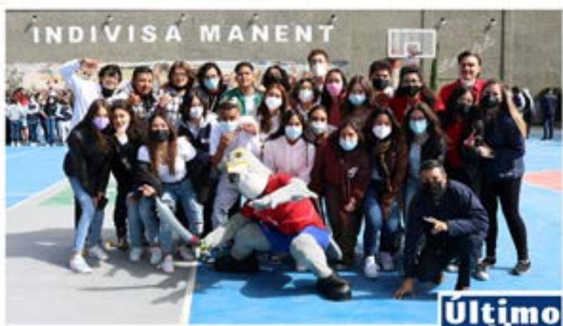
#Bachillerato La Luz