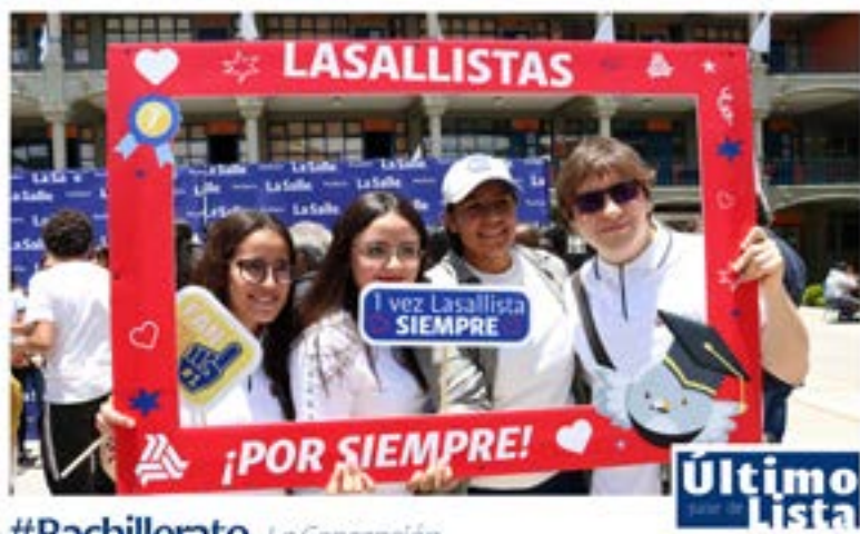
#Bachillerato La Concepción