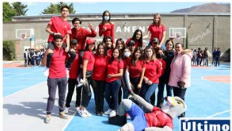
#Bachillerato La Luz