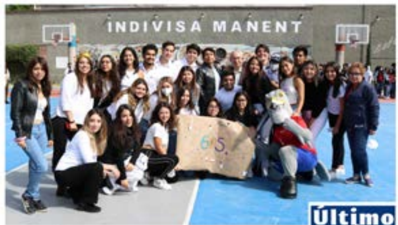
#Bachillerato La Luz