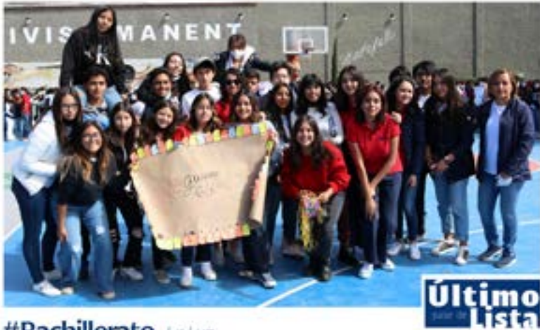
#Bachillerato La Luz