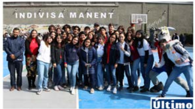
#Bachillerato La Luz