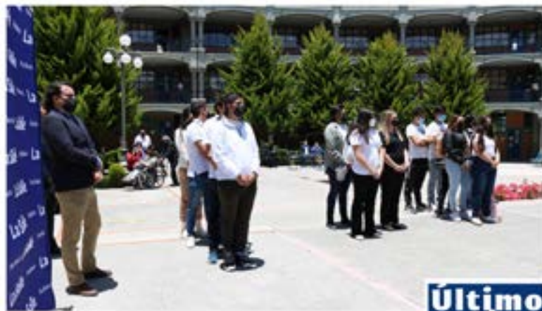
#Bachillerato La Concepción