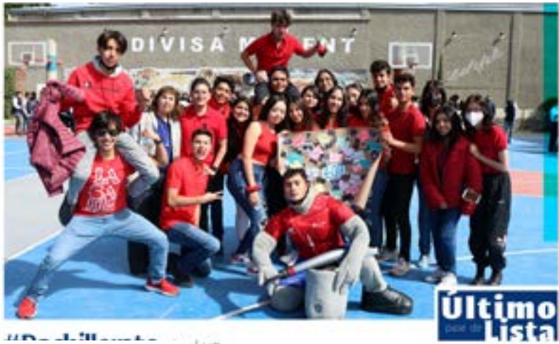
#Bachillerato La Luz