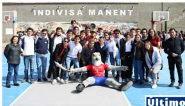
#Bachillerato La Luz