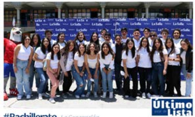
#Bachillerato La Concepción