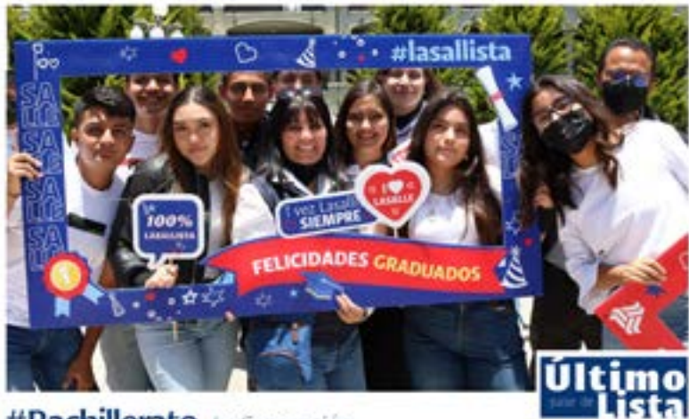
#Bachillerato La Concepción